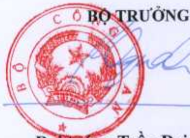
Đại tướng Trần Đại Quang